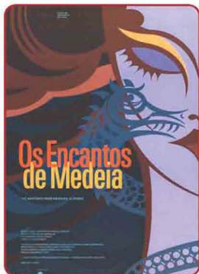
Os Encantos de Medeia de António José da Silva (O Judeu)

Para além disso, terão acesso a actividades culturais dinamizadas pelo Teatro S. João, tais como visitas guiadas e workshops relacionados com os espectáculos em exibição, mediante marcação prévia.